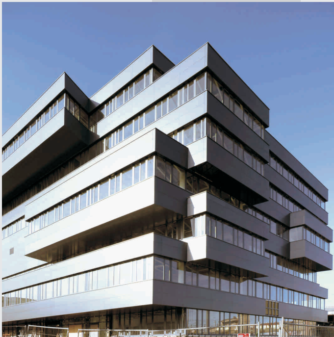
BÜROHAUS LX2 1100 WIEN, LAXENBURGERSTRASSE 2